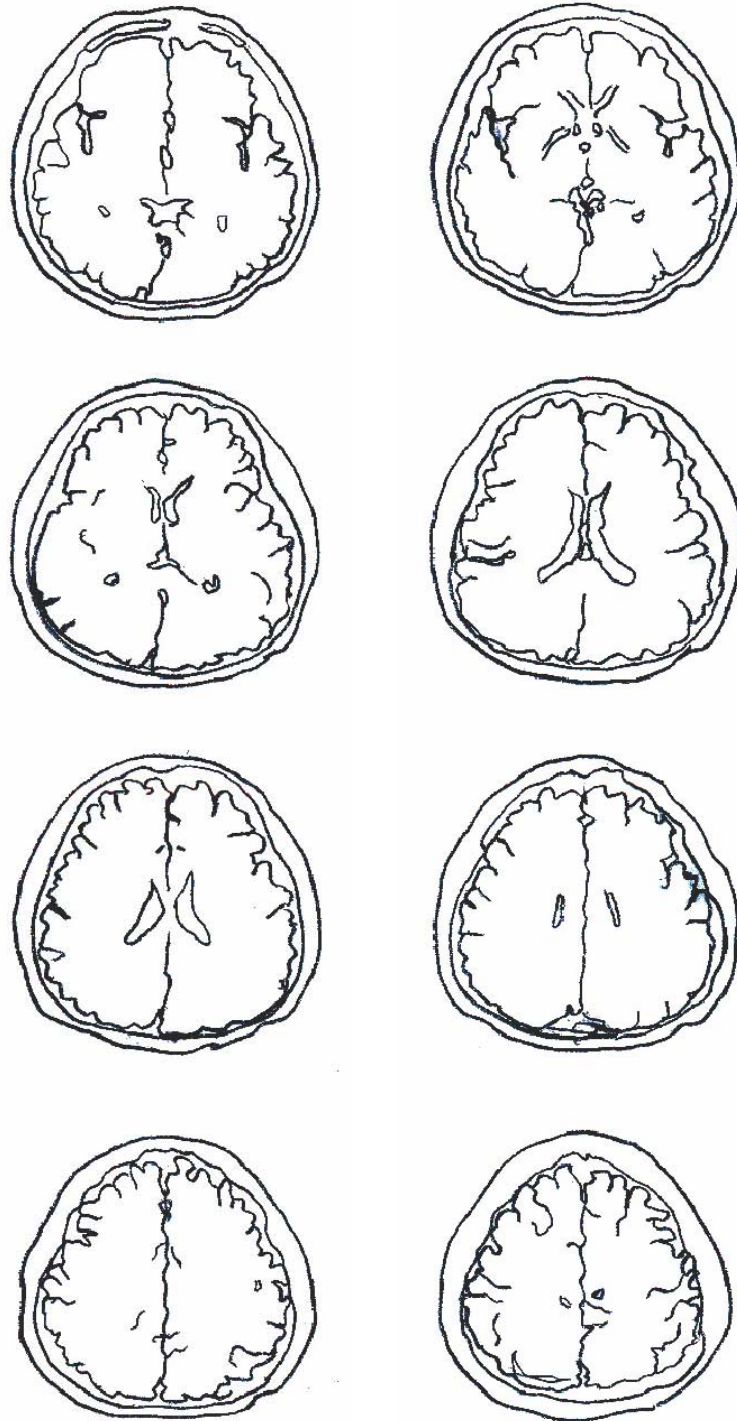
腦中風病變部位標示圖(2)