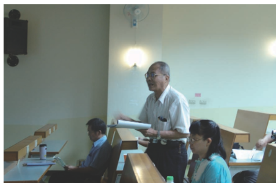
圖五 東區研討會，世界衛生組織(WHO)傳統醫學標準化學術研討會，東區醫師較少，但是最為溫馨