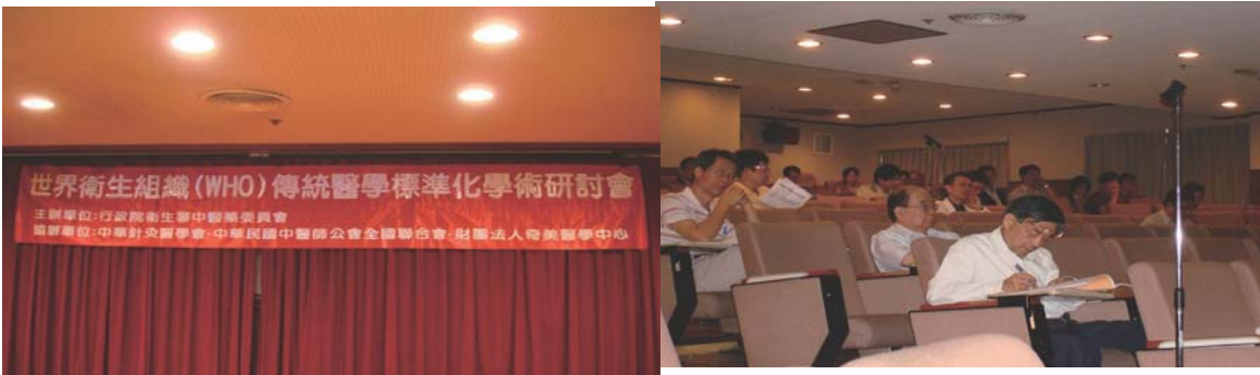
圖二 南區研討會，世界衛生組織(WHO)傳統醫學標準化學術研討會