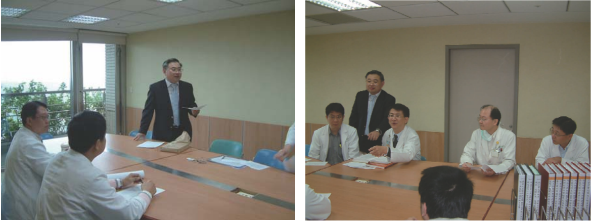
圖一 世界衛生組織傳統醫學標準化之推廣研究第一次專家學者會議