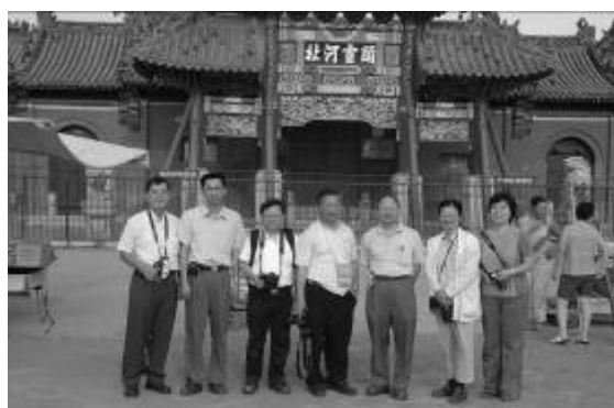
圖九 安國藥材種植試驗場及藥王廟