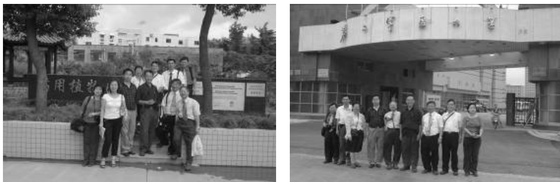
圖十二 上海第二軍醫大學

還要有適應部隊工作需要的體魄和過硬的思想素質。每年招生計畫可上網查悉或見我校每年招生簡章。地方新生入學後辦理參軍手續，在校學習期間享受供給制待遇，家庭享受軍屬待遇。畢業後統一分配到全軍教學、醫療、科研單位工作。