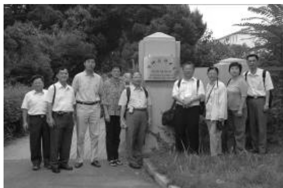
圖三 瀋陽藥科大學