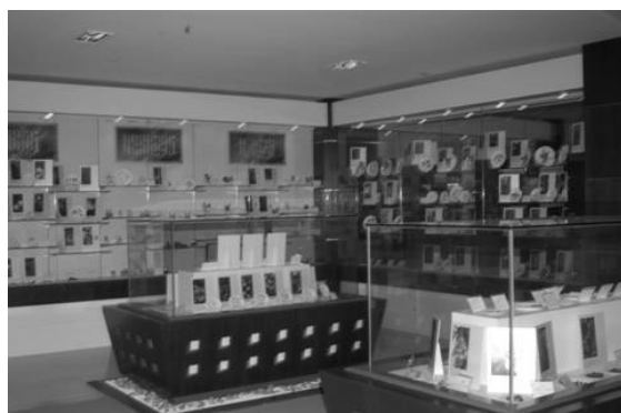
圖十一 上海中醫藥博物館