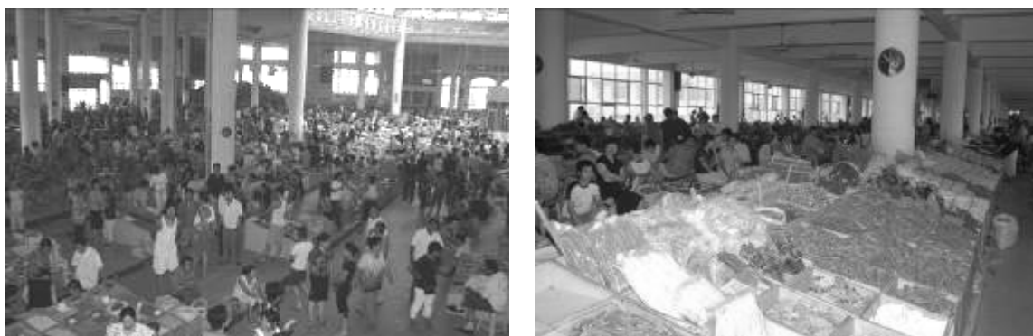
圖七 安國藥材市場交易大廳

目前後 3 種的標準化種植面積達到 1.5 萬畝，品質較高。這些本地產藥材的銷路有：通過交易市場銷售、各地製藥企業定點定時上門收購、本地製藥企業作為原料採購。