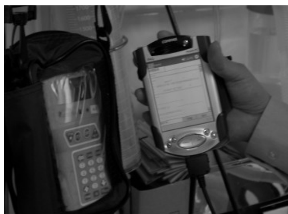
Fig 2 直接將 PCA 資料傳輸至 PDA 上