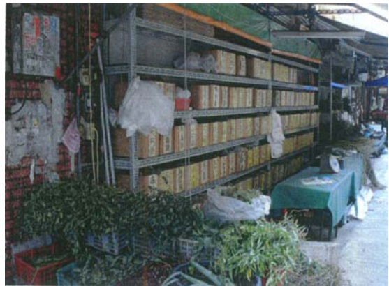
圖十 現今整修後有較整齊之擺設

在台中市政府重新整修青草街之後，目前已呈現明亮且乾淨的店面與路面，並規劃每家店整齊劃一的招牌與路牌。(圖十至圖十二)