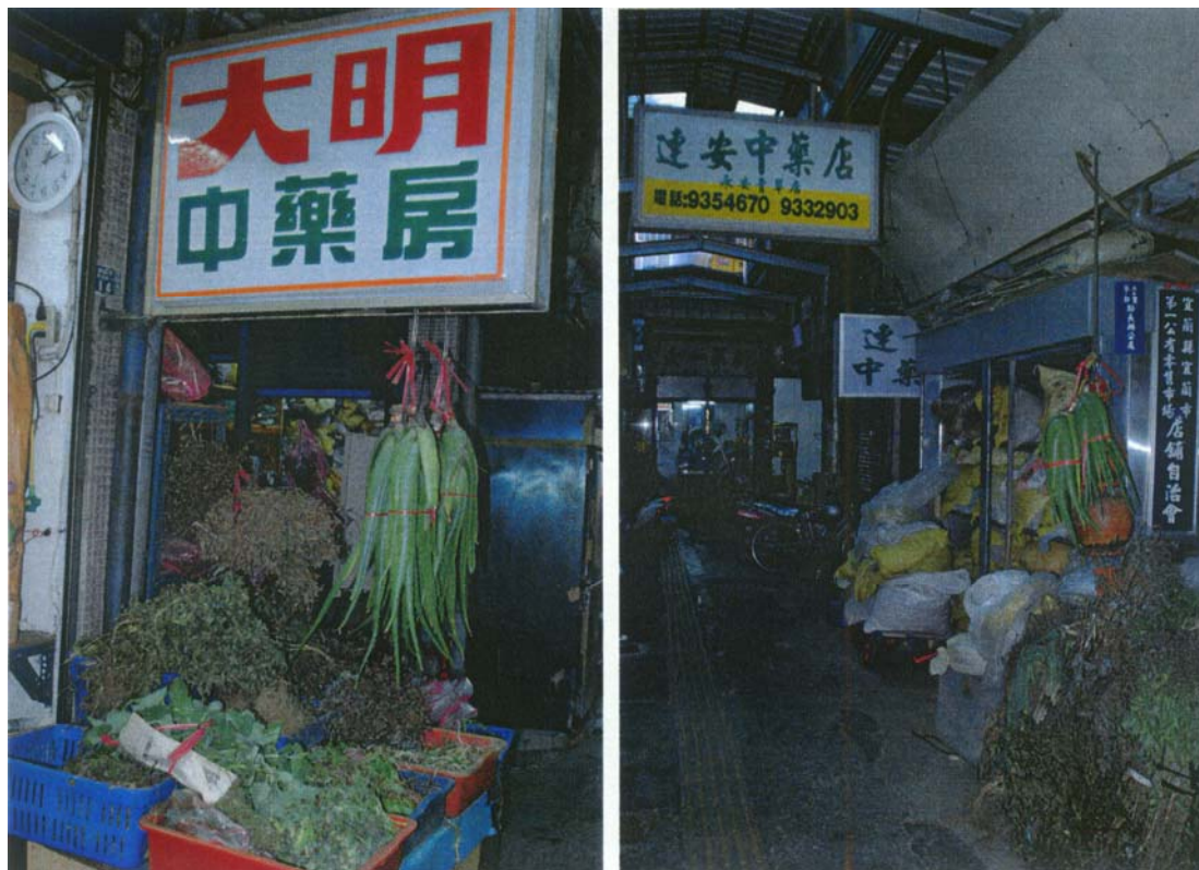
圖二十七 依序左右為第二、第三家青草中藥店，再進入則為宜蘭市第一公有零售市場。(列冊中藥商，販賣青草之店家)