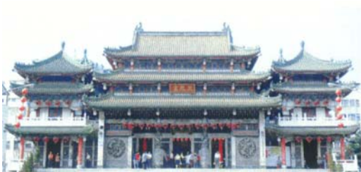
圖十四 三鳳宮的為高雄市的重要信仰中心。

本計畫於 2004 年 1 月 3 日、2004 年 10 月 31 日等數次前往拜訪，取得店家的信任，有問題隨即用電話請教，三鳳宮地區約有 8 家青草店。