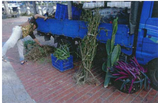
圖十七 藥農使用小貨車將販賣的青草運送至青草店(卸貨中)。

而每當進貨之日，藥農便會用小貨車或機車將其藥草載來賣給店家(圖十七)，而有些新鮮的藥草因為不能再繼續存放(怕發黴)，便在各店家門前的人行道曝曬起藥材。(圖十六)