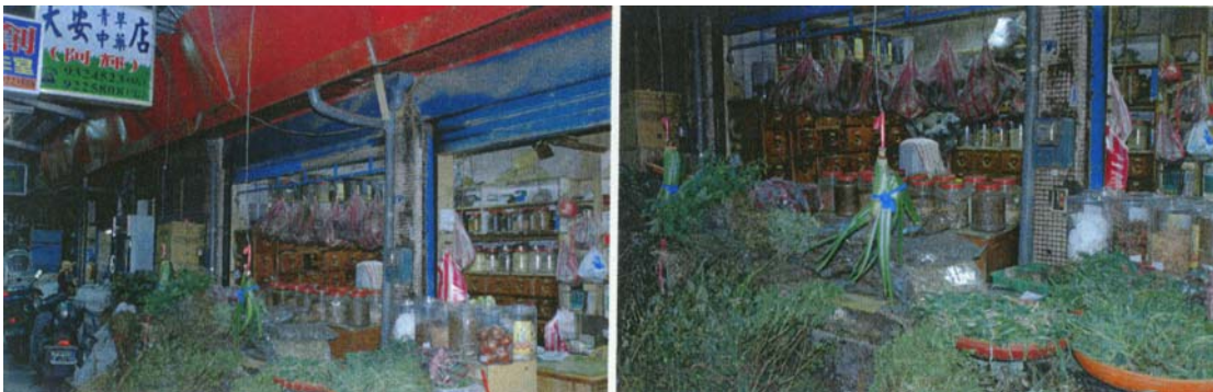
圖二十六 大安青草店為入口第一家店，店內看似中藥藥櫃，其實內裝的都是青草藥頭。外面放置新鮮青草供民眾選購。