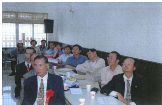
圖三十五 與會貴賓參與討論