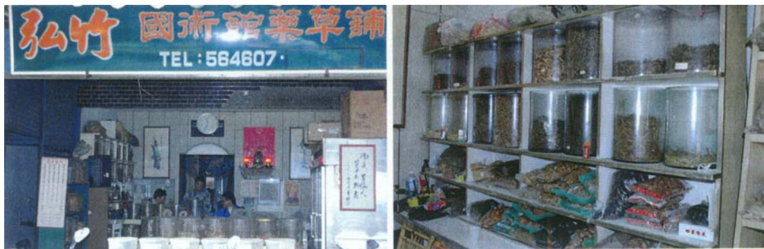
圖二十九 為國術館藥草舖