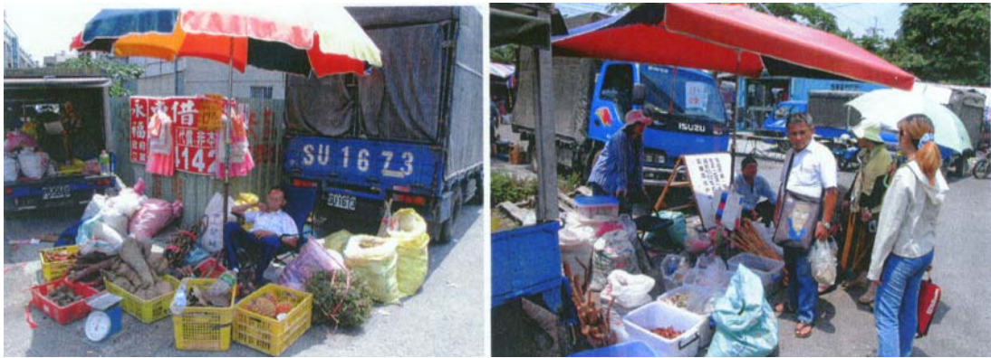
圖二十二 藥農開小貨車，陳列青草，供民眾選購