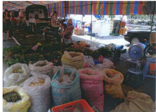
圖十九 乾燥、新鮮的青草藥材，均陳列供民眾選購。

這些青草攤販，有藥農也有在外地開青草店的業者，因籃筐會吸引很多人潮，便向岡山鎮公所申請攤位。(圖十九)