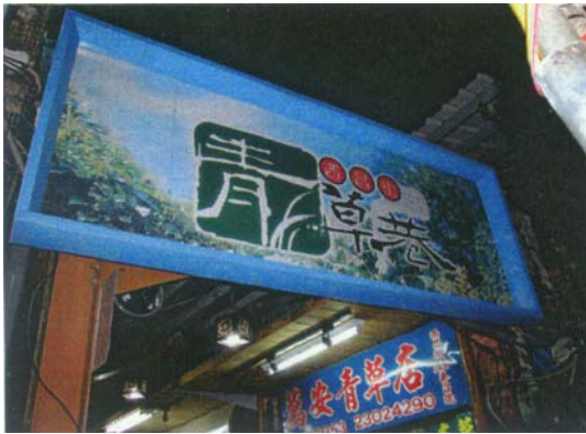
圖一 台北市文化局為西昌街青草巷設立招牌。