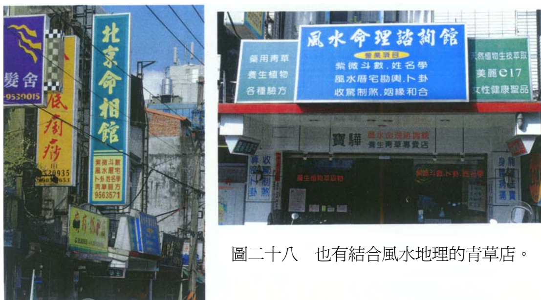
圖二十八 也有結合風水地理的青草店。