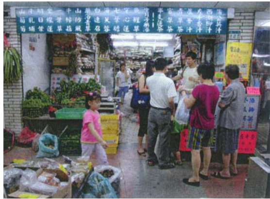
圖六 店面外除了放置新鮮青草外，另有青草茶販賣給客人。

青草巷的店家使用新鮮青草的數量特別的多，一般每一家店約進 100~150 種左右的新鮮青草，而這些青草也因為保存的時間不久，所以均為銷售量最好的品項。