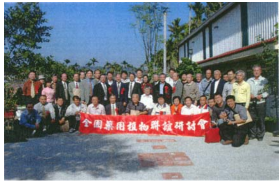
圖三十七 會後大合照