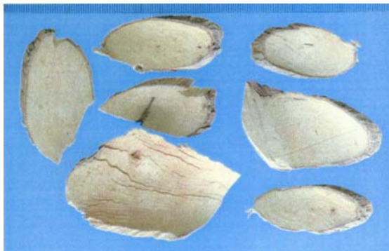
圖四十 千屈菜科 指甲花 Lawsonia inermis Linn.