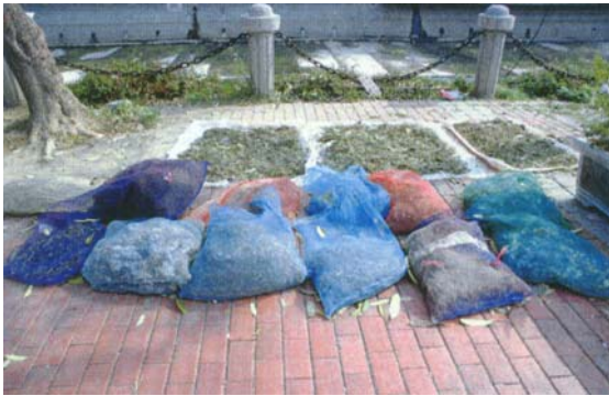
圖十六 各青草店前均有人行道，因此店家將其藥草在此曝曬。

三鳳宮前的青草店，貨源來自台中以南，其中又以高屏地區最大宗，特別是產自屏東縣里港、旗山地區的青草最多、最好，原因是當地有不少的山泉水，草質特佳。南部地區的青草主要匯集於三鳳宮旁河北二路段，人潮眾多。店家自稱已經很難找到像這裡一樣人來人往的店面。店家老闆均為 40~50 歲的中年人。