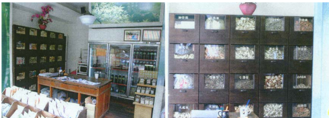
圖三十一 其青草茶包區及放置青草藥頭之藥櫃