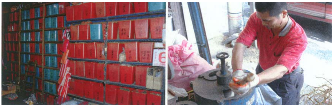
圖二十四 店家的擺設與其切藥頭，為列冊中藥商