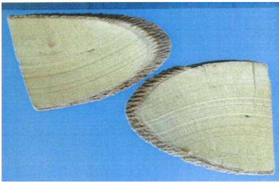
圖三十八 錦葵科 山芙蓉 Hibiscus taiwanensis S. Y. Hu

目前共收集 298 中青草藥材 (如附錄表十三), 購買 300 個標本瓶 (圖四十一), 擬建立青草藥材標本庫。已購買照相設備, 建立青草藥材照片圖庫, 以利鑑定。(圖三十八至圖四十一)