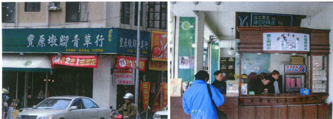
圖三十 店面與飲料調配櫃台

本計畫於 2004 年 4 月 7、8 日拜會豐原墩腳青草行，豐原土地公廟內有 2 家販賣新鮮青草的攤販，而墩腳青草行是其中一家開的分店。因為現代年輕人對於青草藥的接受度不高，於是老闆便把傳統的青草店改成現代茶吧。(圖三十、圖三十一)