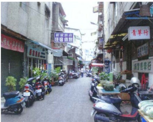
圖七 台中市成功路 90 巷整修前原貌。(柏油路地面)

因台中市中區的商圈近年來逐漸沒落，已轉移至西屯區、中港路這一帶，台中市政府為了振興中區商圈，於是規劃了數個商業特色街道，其中台中市成功路 90 巷、綠川西街這兩條路之中，早已聚集了 6 家以上的青草店，於是市府便規劃為青草街。(圖七、圖八)