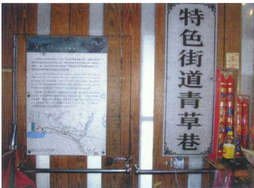
圖三 台北市政府文化局設立之青草巷解說牌。

政府單位在這條百年老巷子，裝上了擋雨棚、藝術燈光、採光棚、石板地坪、花草紋與吉祥圖案的人孔蓋、仿古鑄燈等。並且在廣州街 209 巷的通道牆壁上設置 12 面的解說牌，包括中、英、日三種語言。(如圖三)