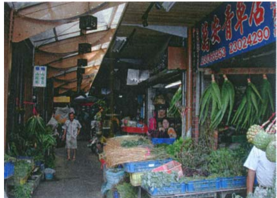
圖二 青草巷實際上是指圖中這一條不到 100 公尺的巷子。

政府單位在這條百年老巷子，裝上了擋雨棚、藝術燈光、採光棚、石板地坪、花草紋與吉祥圖案的人孔蓋、仿古鑄燈等。並且在廣州街 209 巷的通道牆壁上設置 12 面的解說牌，包括中、英、日三種語言。(如圖三)