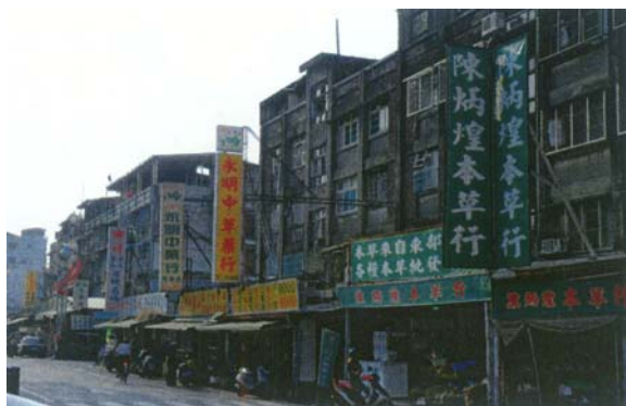
圖十五 河北二路的青草店

三鳳宮(如圖十四)是個台灣民間信仰的重地，民間習慣的草藥自然是周邊不可或缺的產物，原來是廟前擺攤的青草商人，後來在廟旁邊租或買下店面，