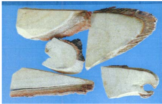
圖三十九 橄欖科 杆仔根 Canarium album (Lour.) Raeuschel