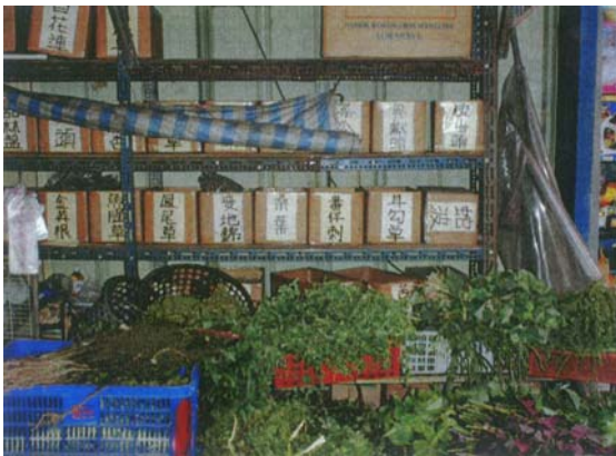
圖九 整修前原本各家青草店的產品幾乎堆疊至路面

成功路青草街原屬於第一市場的一部份，自從第一市場慘遭祝融之災改建為第一廣場後，原來的青草街依然固我，仍保留原貌，巷內還是窄而雜亂，與改建的第一廣場甚不搭調。(如圖九)