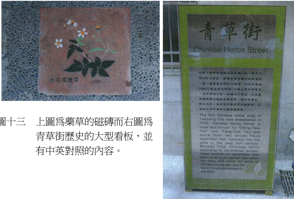
圖十三 上圖為藥草的磁磚而右圖為青草街歷史的大型看板，並有中英對照的內容。

另外，除了立大型看板在路口解釋青草街的歷史外，街道的地板上也鋪設了七種藥草磁磚，以讓遊客欣賞。(圖十三)