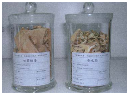
圖四十一 裝藥材之標本瓶