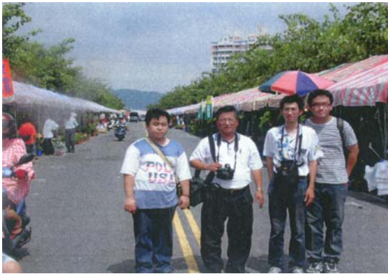
圖十八 籃筐會河華路段，延綿 2 公里的攤位。