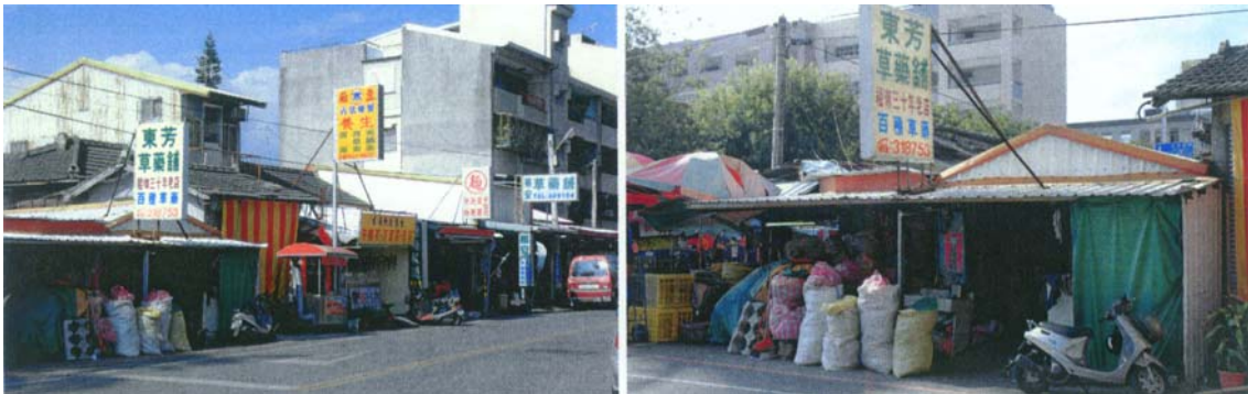
圖二十三 台東市五權街的 2 家青草店，其青草貨源為台東的山區