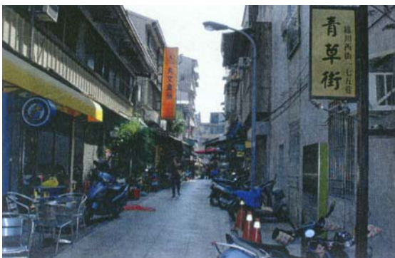
圖十一 明亮乾淨的路面

在台中市政府重新整修青草街之後，目前已呈現明亮且乾淨的店面與路面，並規劃每家店整齊劃一的招牌與路牌。(圖十至圖十二)