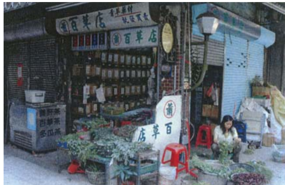
圖十二 乾淨的店面與招牌 (金色部份有撰寫其歷史)

這些青草店不只買賣青草，更提煉青草茶、冬瓜茶、養肝茶、洛神茶、靈芝茶、枸杞茶等，雖然青草店老闆並非中醫師，但他們可懂得不少民俗醫療偏