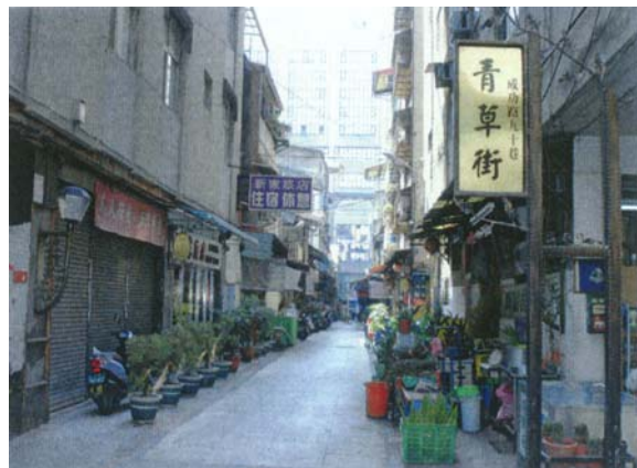
圖八 台中市成功路 90 巷整修後命名為青草街。(地板重建)