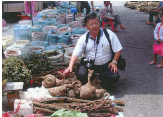
圖二十一 店家將其販售之青草藥頭，陳列地上以供民眾選購。

其中有一條約 100 公尺的巷道，專賣青草，藥農或店家到山上採藥或向大盤批發藥頭，向公所申請攤位後，便做起生意來。