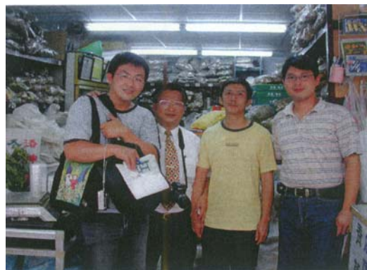
圖四 一順青草店的老闆，其四兄弟分別在西昌街開設四家青草店。

現在西昌街與青草巷聚集約 18 家的青草店，每當假日或夜晚，人潮總是特別的多，也因為競爭激烈，彼此之間青草藥也要相同，以免被客人誤會成亂拿青草給他使用。