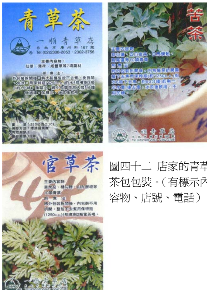
圖四十二 店家的青草茶包包裝。(有標示內容物、店號、電話)