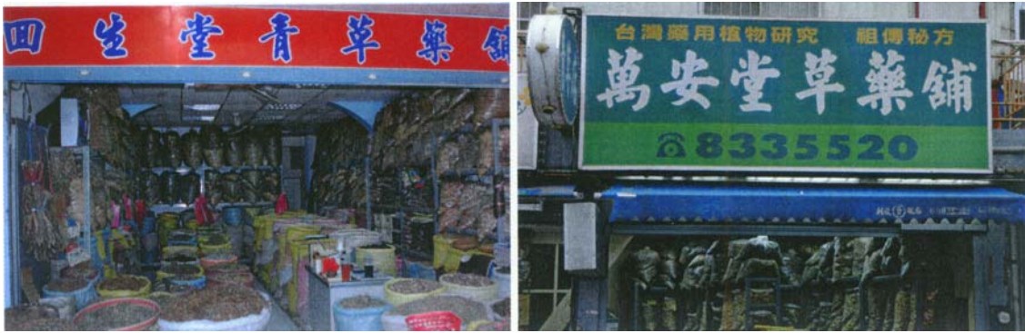
圖二十五 花蓮市鬧區兩家青草店，其擺設整齊明亮，青草貨源為花蓮山區，有相關之藥農協助店家取得貨源。