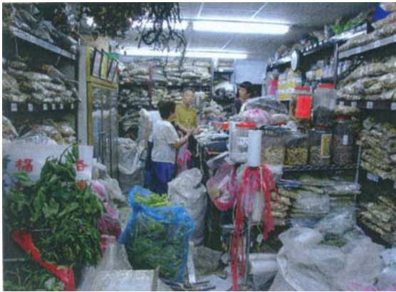
圖五 其店面擺滿了各式各樣的青草藥材，並用塑膠袋裝好。