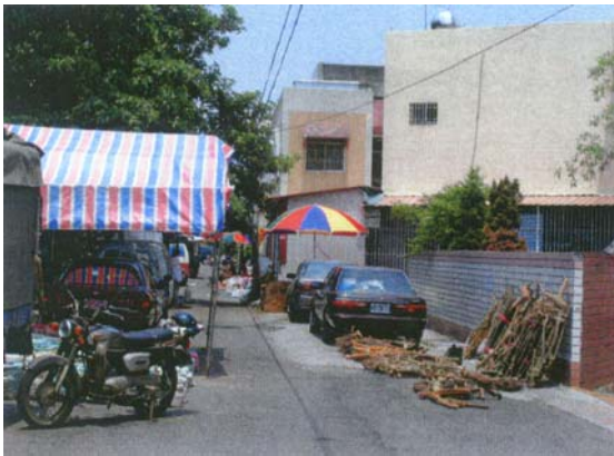
圖二十 這一條 100 公尺的巷道，聚集了 10 幾攤青草攤販。

這些青草攤販，有藥農也有在外地開青草店的業者，因籃筐會吸引很多人潮，便向岡山鎮公所申請攤位。(圖十九)