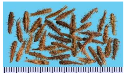
地上部果實特徵圖