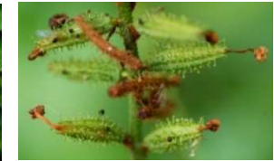
原植物生態特徵圖