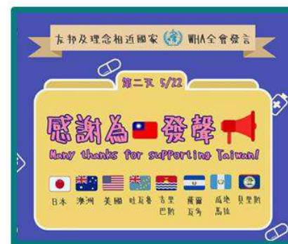
▲ 外交部整理全會發言