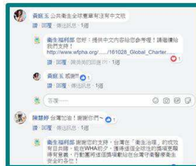
▲ 小編即時回應網友提問