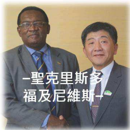
—聖克里斯多 福及尼維斯—