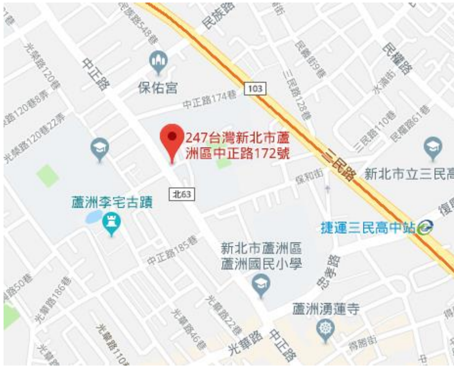
國立空中大學蘆洲校本部平面圖