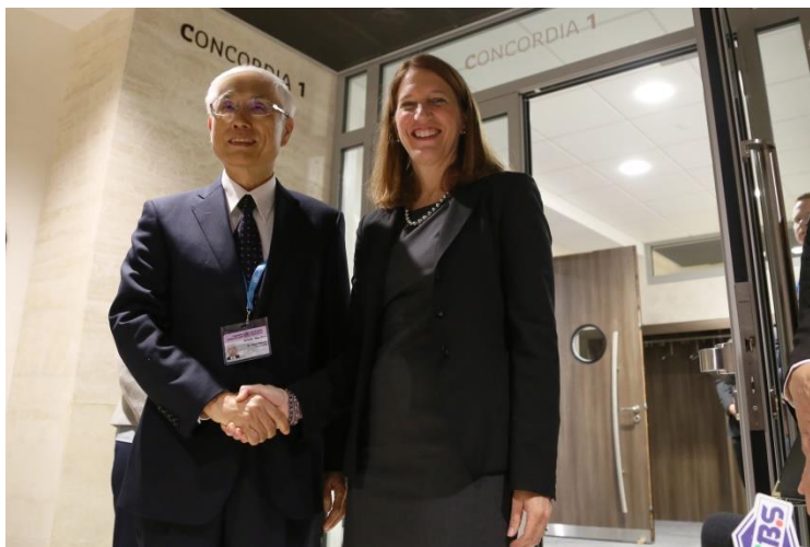
美國衛生部長 Sylvia Mathews Burwell