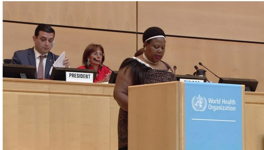
史瓦濟蘭衛生部長為我發聲