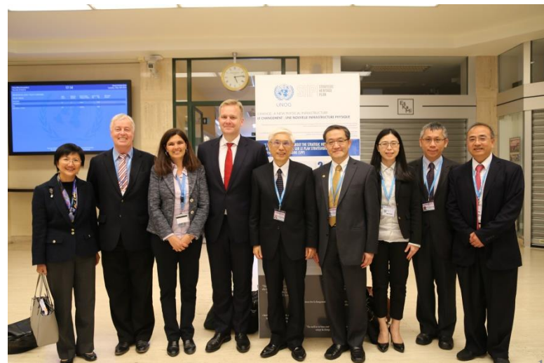
歐盟駐聯合國代表團