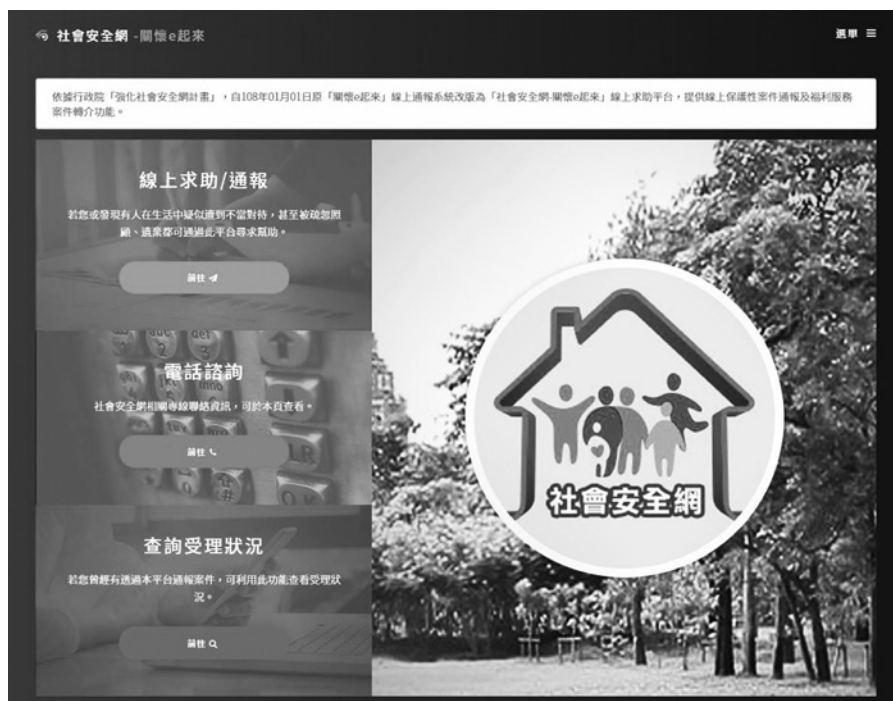
圖 2 社會安全網