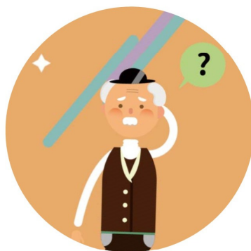
50歲以上 失智症患者