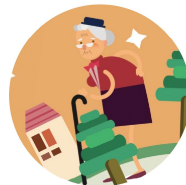
日常生活需他人協助的 獨居老人或衰弱老人