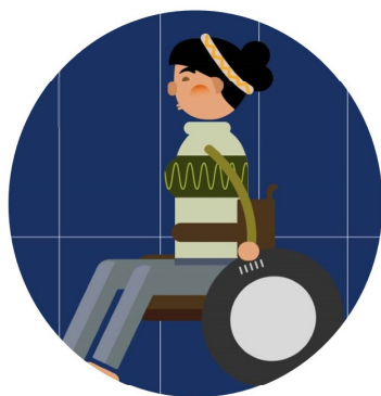
55歲以上 失能原住民