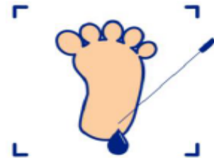
108年21項疾病異常個案數