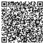
報名表 QR Code