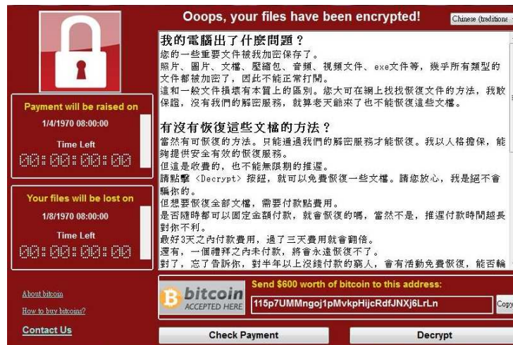
圖一 加密勒索病毒入侵電腦畫面示意

如電腦以遭駭客鎖定入侵(如下圖)，則須立即通報主管機關(如各縣市衛生局)，以儘速做必要的網路隔離及啟動相關防禦機制，並主動報警處理與備案