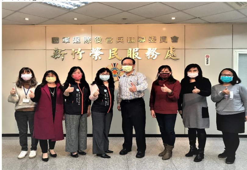
圖2：健保署北區業務組與新竹榮民服務處，共同推動『跨機關 e 化服務~榮民遺眷加保免奔波』合作計畫2.0。