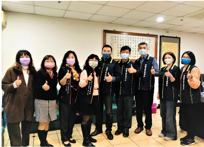
圖1：健保署北區業務組與桃園榮民服務處，共同推動『跨機關 e 化服務~榮民遺眷加保免奔波』合作計畫2.0。

NATIONAL HEALTH INSURANCE ADMINISTRATION, MINISTRY OF HEALTH AND WELFARE