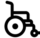
輔具及居家 無障礙環境改善