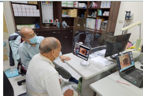
實驗場域遠距會診情形