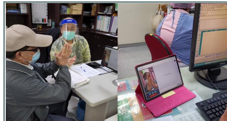
與新陳代謝科醫師進行遠距會診