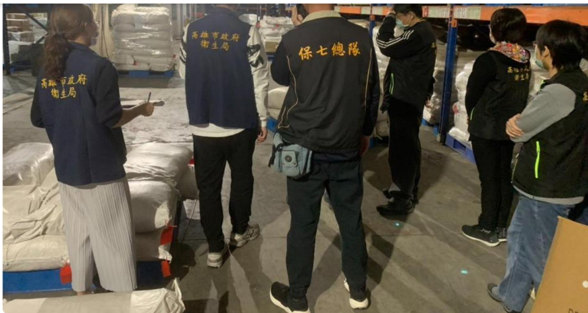
高雄市衛生局日前主動抽驗及會同食品藥物管理署抽驗轄內餐飲業及輸入業。資料照。高雄市衛生局提供

3、高雄地檢署於今年3月1日指揮警政署刑事警察局，會同高雄市政府衛生局、食品藥物管理署南區管理中心，查封「海順國際食品有限公司」、「津棧國際貿易有限公司」、「佳廣國際貿易有限公司」違規產品共3萬2739公斤，另流向新北市、桃園市、台中市、彰化縣、雲林縣、臺南市、高雄市的違規產品共3萬4414公斤，已通知各縣市衛生主管機關監督下架事宜。