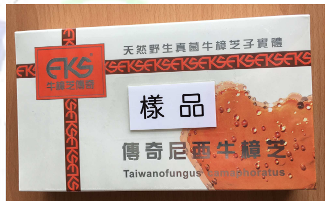
傳奇尼西牛樟芝膠囊