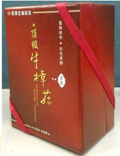
牛樟菇菁醇軟膠囊