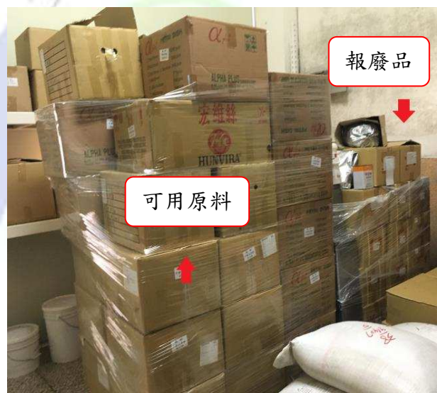
廢棄物未專區存放