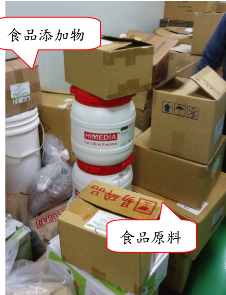
食品添加物與原料混放，未落實三專管理