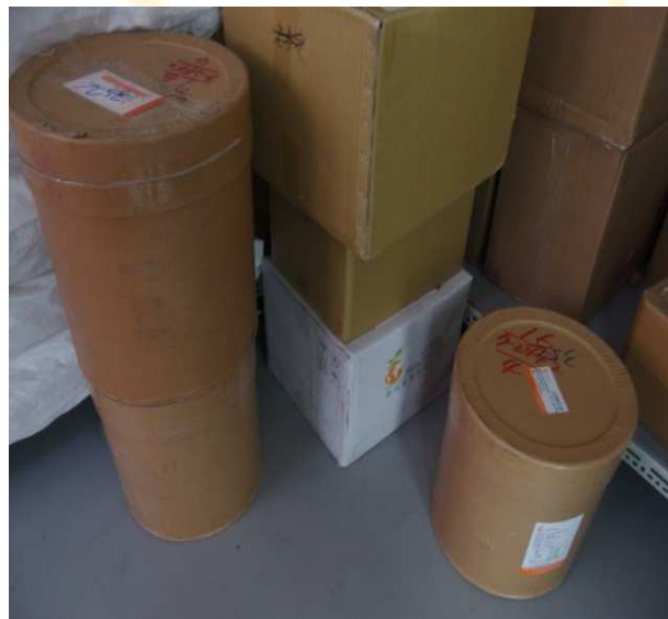
食品未離牆離地貯放